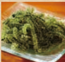
海ぶどう Sea grapes ¥660