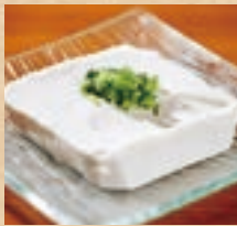
ジーマミー 豆腐 Peanut Tofu ¥490