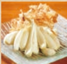
島らっきょ Chinese Onion ¥550