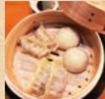
アグー豚と 石垣牛の 点心盛り合わせ Agu Pork & Ishigaki Beef Dim Sum Platter ¥1,320