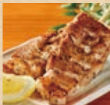
アグー豚の 串焼き (2本) Pork Cartilage Spare Rib ¥660