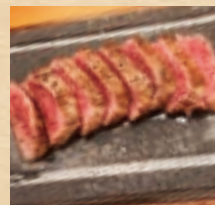
石垣牛の 極上赤身ステーキ (120g) Premium Ishigaki Beef Lean Steak ¥3,080