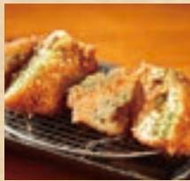
アグー豚の 自家製メンチカツ (2個) Homemade Minced Agu Pork Cutlet ¥660