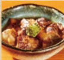
軟骨ソーキ Pork Cartilage Spare Rib ¥660