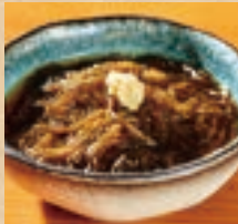
もずく Mozuku Vinegar ¥520