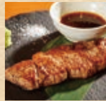
石垣牛の串焼き (1本) Skewers of Ishigaki Beef ¥1,080