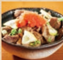
石垣牛の 牛すじボン酢 Stewed Ishigaki Beef Tendons ¥660