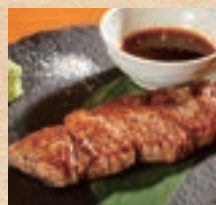
石垣牛の串焼き (1本) Skewers of Ishigaki Beef ¥1,080