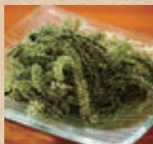
海ぶどう Sea grapes ¥650