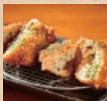
アグー豚の自家製メンチカツ (2個) Homemade Minced Agu Pork Cutlet ¥630