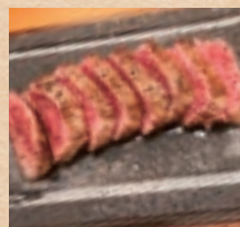
石垣牛の極上赤身ステーキ (120g) Premium Ishigaki Beef Lean Steak ¥3,080