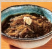
もずく Mozuku Vinegar ¥520