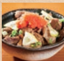
石垣牛の牛すじボン酢 Stewed Ishigaki Beef Tendons ¥630