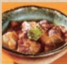
軟骨ソーキ Pork Cartilage Spare Rib ¥630