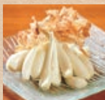
島らっきょ Chinese Onion ¥550