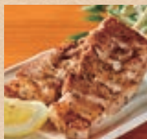
アグー豚の串焼き (2本) Pork Cartilage Spare Rib ¥630