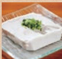
ジーマミー豆腐 Peanut Tofu ¥490