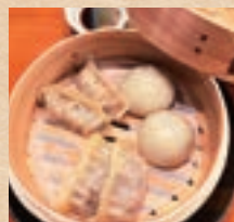
アグー豚と石垣牛の点心盛り合わせ Agu Pork & Ishigaki Beef Dim Sum Platter ¥1,320